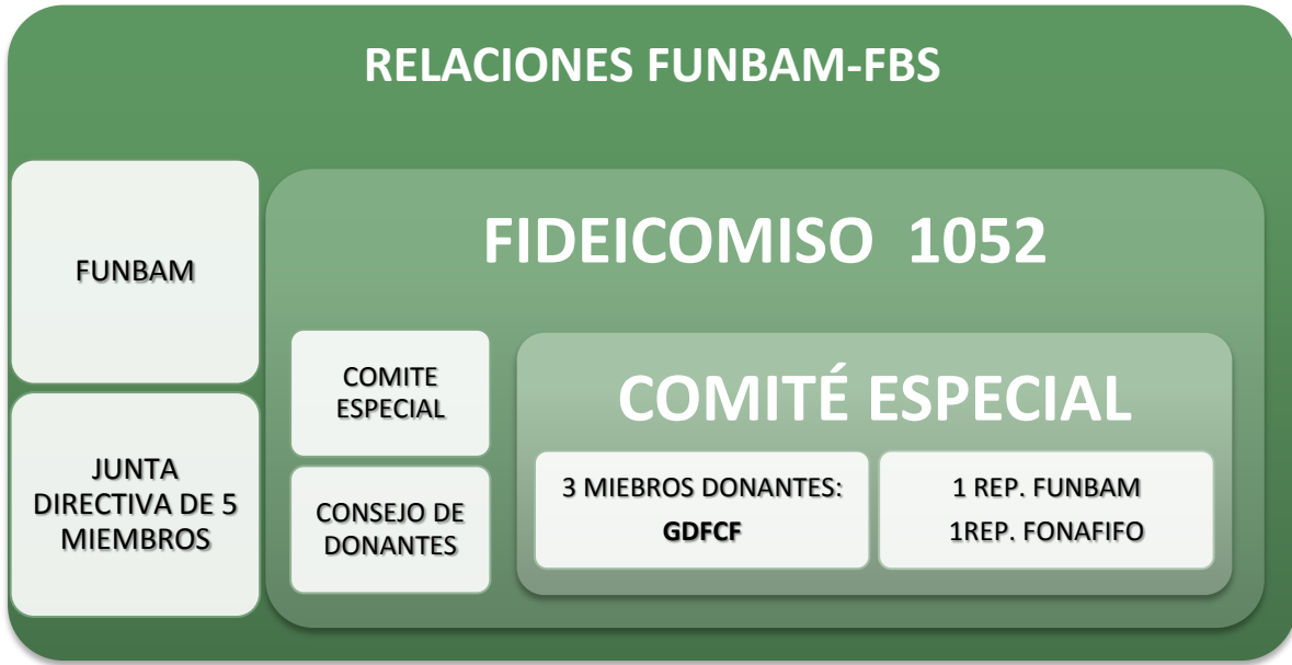
Figura 3. Figura que Muestra la Relación entre el FONAFIFO, FUNBAM y FBS.