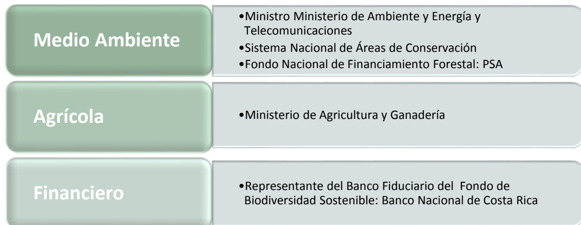
Figura 2. Organigrama de la Fundación Banco Ambiental. Costa Rica 2013